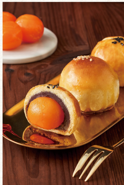
訂購編號 18-3 1F/ 阿默蛋糕 秋月禮盒 (葷) 推薦價 550 元 蛋黃酥 (烏豆沙) 3 入 紅豆 Q 餅 2 入 傳統鳳梨酥 5 入 服務專線 02-6632-8999#1605