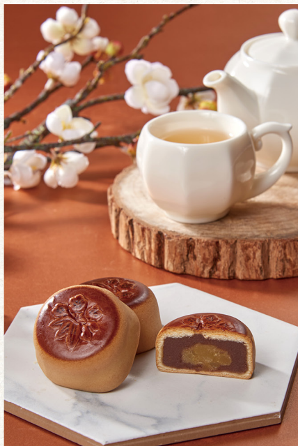
訂購編號 20-2 1F/ 源吉兆庵 織部錦 原價 640 元 特價 570 元 栗子紅豆糕 6 入 服務專線 02-2314-1217