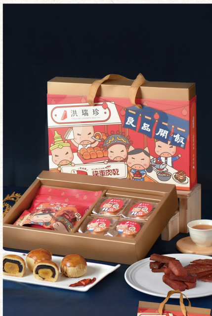
訂購編號 18-5 1F/ 洪瑞珍 中秋環遊味覺禮盒 原價 699 元 特價 550 元 蜜汁豬肉乾 5 入 + 麻辣鍋豬肉乾 5 入 酸辣豬肉乾 5 入 + 豆沙蛋黃酥 1 入 椒麻蛋黃酥 1 入 + 芋頭流芯蛋黃酥 1 入 紅豆麻糬蛋黃酥 1 入 服務專線 02-6632-8999#1131