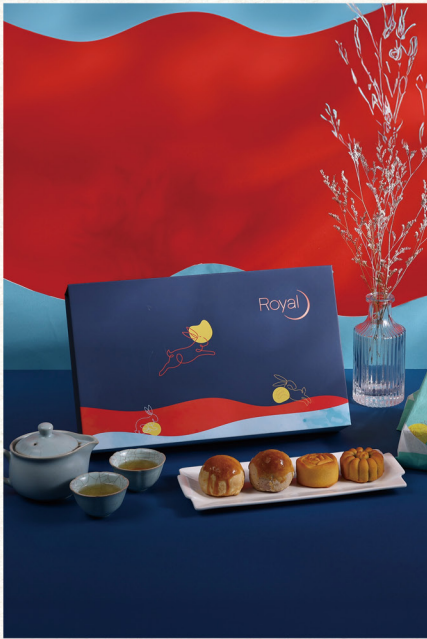
訂購編號 4-1 老爺酒店 頌月 (蛋黃酥 / 桃山) 推薦價 1,080 元 / 盒 紫地瓜松子蛋黃酥、芋頭麻糬蛋黃酥 烏龍茶脆梅 (桃山)、奶黃流心 (桃山)