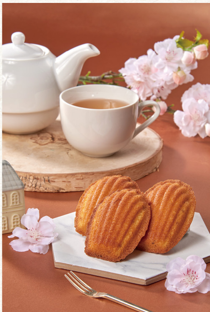
訂購編號 20-1 1F/ 法國的秘密甜點 法式瑪德蓮禮盒 原價 480 元 特價 429 元 瑪德蓮 6 入 服務專線 02-6632-8999#1802