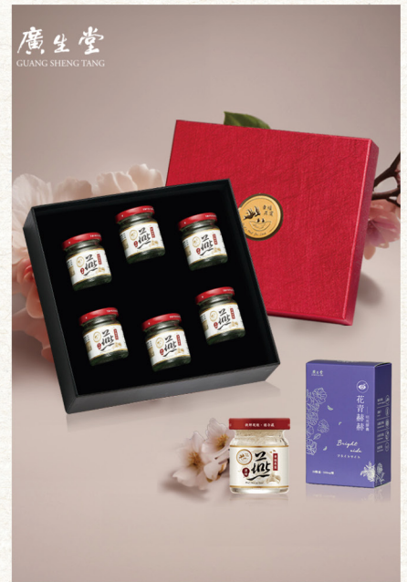
訂購編號 4-6 廣生堂 濃縮冰糖燕窩禮盒 原價 13,380 元 特價 10,888 元 濃縮冰糖燕窩 60ml (12 入) 加贈：花青素明亮膠囊 (30 顆) × 1 廣生堂常銷產品之一的濃縮冰糖燕窩飲 60ml 內容為滿滿一瓶燕窩，水分少。 適合剛開始認識燕窩、品嚐燕窩的您。