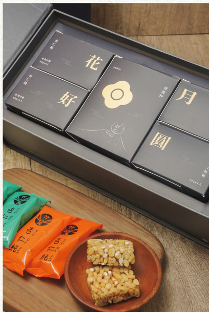
訂購編號 20-5 1F/ 竹光杏仁純 花好月圓杏福禮盒 原價 1,788 元 特價 1,688 元 杏仁純+手工酥糖+限量周邊商品 加贈即飲即食兌換券乙張 服務專線 02-6632-8999#1111