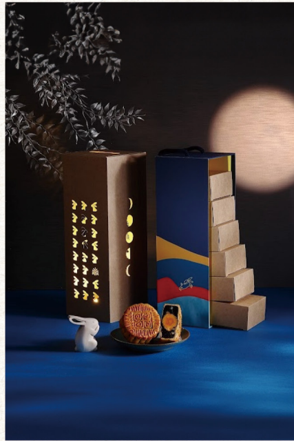
訂購編號 4-2 老爺酒店 光影 (六中月) 推薦價 1,580 元 / 盒 古早滷肉、土鳳梨火山豆、桂圓紅棗、美人茶桑椹 奶黃蔓越莓、棗泥核桃蛋黃