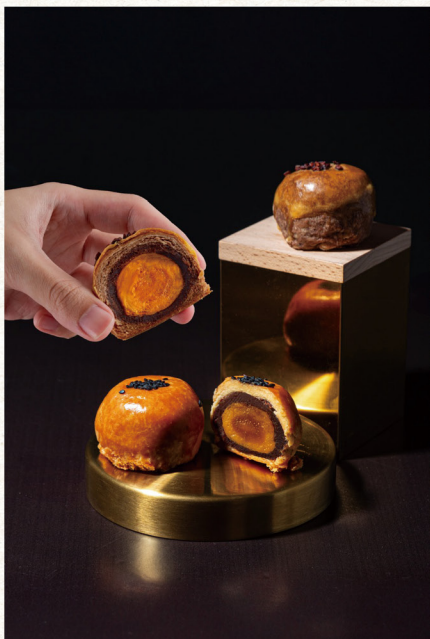
訂購編號 18-1 1F/ 郭元益 頂級蛋黃酥 禮盒 (綜合) 原價 680 元 特價 628 元 頂級蛋黃酥 4 入 巧克力頂級蛋黃酥 4 入