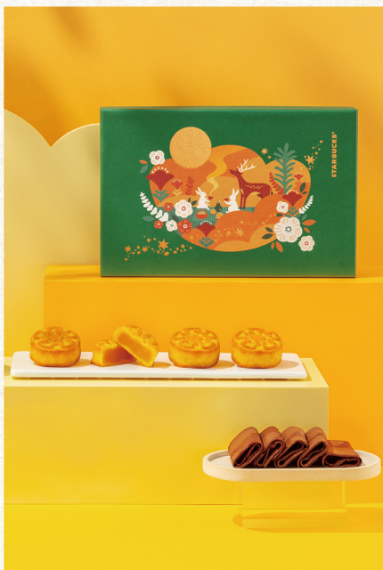
訂購編號 18-4 2F/ 星巴克 月光序曲 推薦價 800 元 原味奶皇月餅 4 入 + 經典可可薄餅 2 入 7/24 至 9/5 凡購買即贈 飲料買一送一券 7/24 至 8/20 星禮程會員 85 折優惠 8/21 至 9/5 星禮程會員 9 折優惠