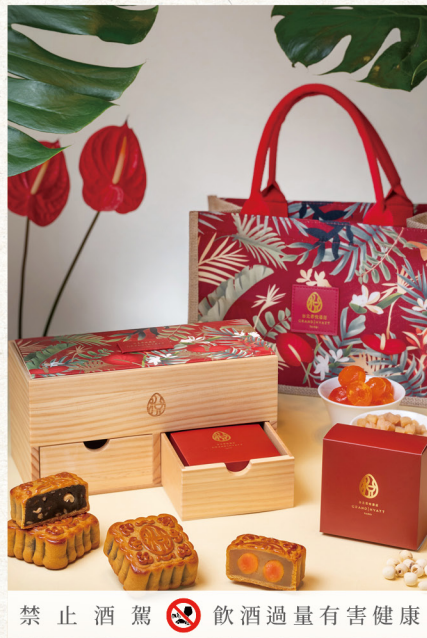
訂購編號 4-5 台北君悅酒店 豪華款 赤悅隆心中秋寶盒 推薦價 1,980 元 5 兩 (188g) - 廣式月餅 4 入裝 紫薯夏威夷果 (奶蛋素) 棗泥核桃 (蛋素) 蓮蓉雙黃 (葷食 - 含蛋、米酒, 無肉) XO 干貝 (葷食)