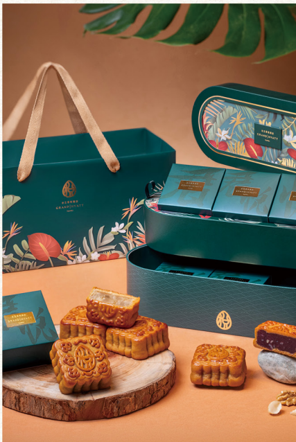
訂購編號 4-4 台北君悅酒店 經典款 碧悅豐華中秋禮盒 推薦價 1,280 元 2.5 兩 (93.75g) - 廣式月餅 6 入裝 棗泥核桃 (蛋素)、伍仁珍果 (葷食) 特製文旦 (奶蛋素)、百香果柚丁 (奶蛋素) 東方美人茶桑椹 (蛋素)、紫薯夏威夷果 (奶蛋素)