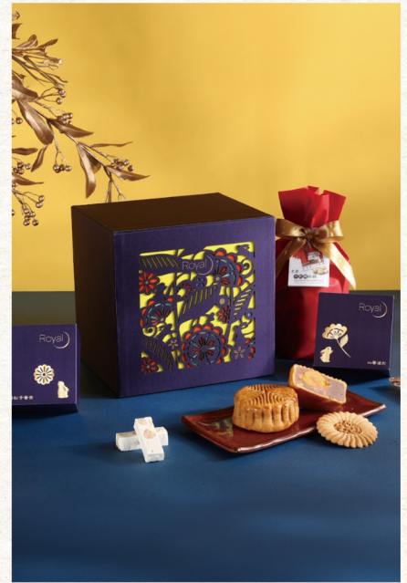
訂購編號 4-3 老爺酒店 經典雙層 推薦價 2,080 元 / 盒 上層 | 白蓮蓉松子蛋黃、桂圓紅棗、XO 醬滷肉、美人茶桑椹 下層 | 夏威夷果仁牛軋糖 15 入 / 包、拉拉山水蜜桃餅乾 1 片、 鹽之花楓糖果仁塔 1 顆、柚子卡蕾特餅乾 1 片羅馬盾牌 餅乾 2 片 / 包、紅水烏龍腰果餅乾 4 片 / 包