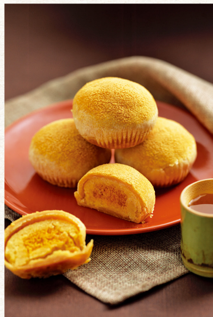
訂購編號 18-6 B1F/ 王師父 金月娘禮盒 (9 入) 推薦價 855 元 服務專線 02-6632-8999#8019