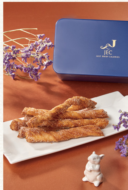
訂購編號 20-6 1F/JEC 辦可頌 推薦價 420 元 服務專線 02-2312-1639