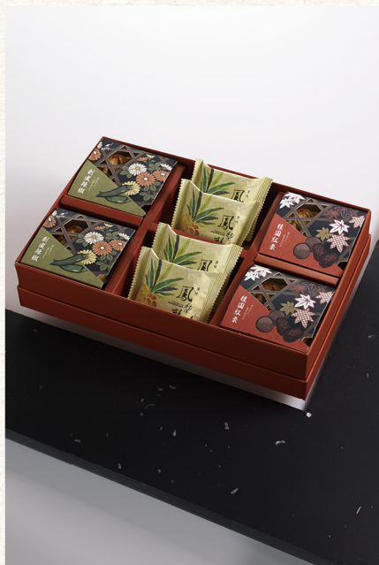
訂購編號 18-2 1F/ 手信坊 大和之秋 原價 890 元 特價 750 元 大月餅 - 剝皮辣椒 2 入 大月餅 - 桂圓紅棗 2 入 手信坊 - 原味鳳梨酥 4 入 服務專線 02-6632-8999#1603