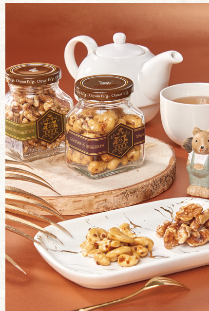
訂購編號 20-3 1F/ 泉發蜂蜜 堅果禮盒 原價 610 元 特價 550 元 榆樹花粉蜜腰果+ 茶花粉蜜核桃+中木盒 服務專線 02-6632-8999#1166