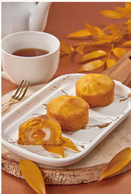
訂購編號 20-4 1F/ 查理布朗 爆漿芝士 麻糬餅禮盒 原價 432 元 特價 388 元 爆漿芝士麻糬餅 6 入 服務專線 02-6632-8999#1704